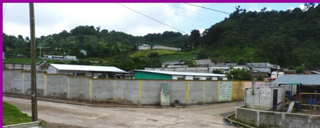
De muur, na het pleisteren

In tussentijd was het werk al begonnen in april van dit jaar met reparaties van de muur en vervolgens het pleisteren, uitgevoerd door de metselaar van de gemeente San Andrés Itzapa en de mannen uit Chimachoy.