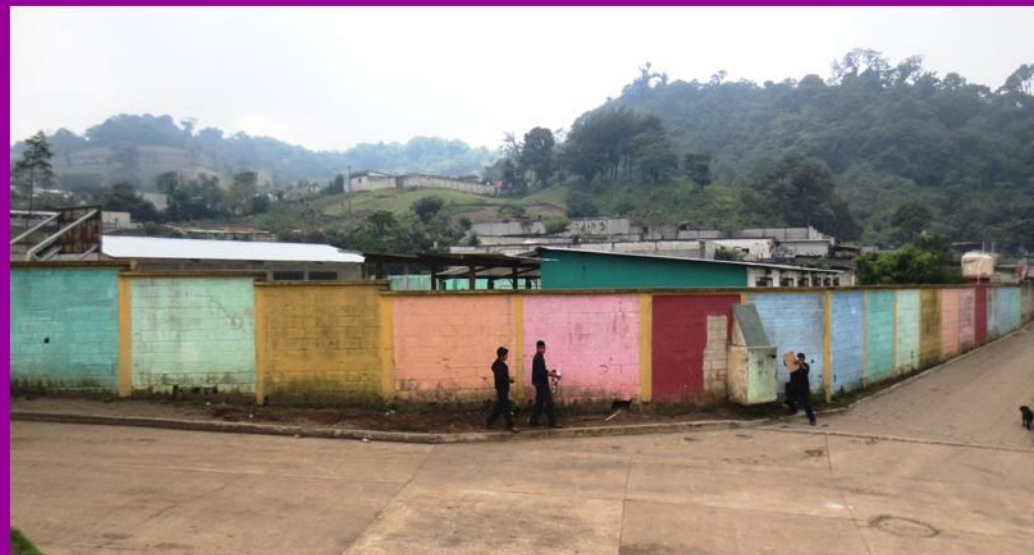
De muur, voor...

In tussentijd was het werk al begonnen in april van dit jaar met reparaties van de muur en vervolgens het pleisteren, uitgevoerd door de metselaar van de gemeente San Andrés Itzapa en de mannen uit Chimachoy.